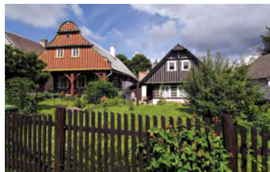
Karlovy, Lomnice nad Popelkou