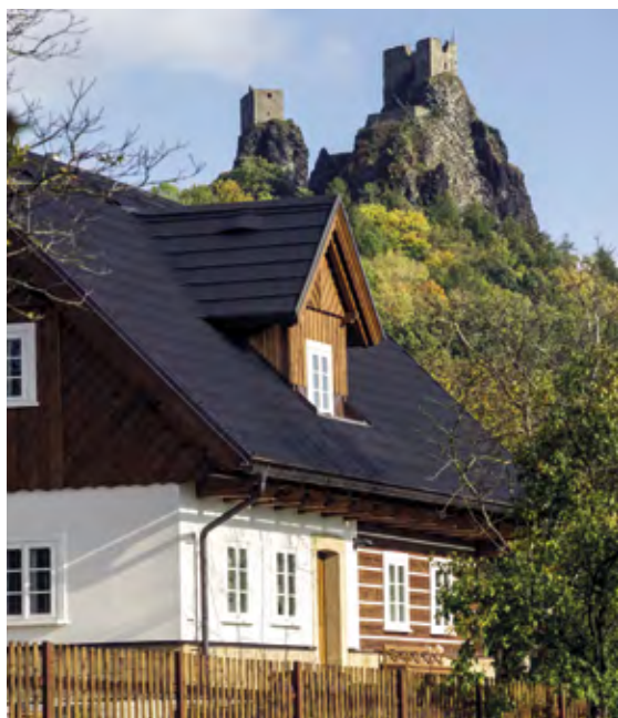
Zřícenina hradu Trosky