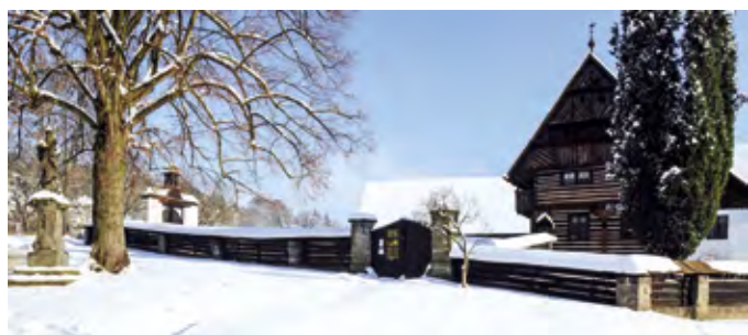
Dlaskův statek, Dolánky u Turnova