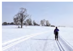
Lomnická lyžařská magistrála