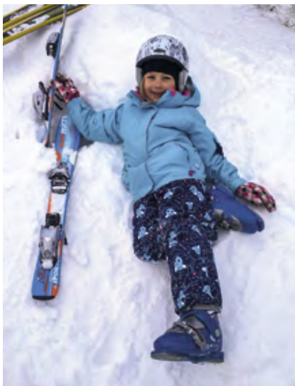
Zimní radovánky v Českém ráji

Auch auf einigen Burgen und Schlössern herrscht außerhalb der Saison reger Betrieb. Auf dem Schloss Dětenice finden an den Samstagen Winterritterturniere und ungewöhnliche Besichtigung bei Kerzenschein statt. Ganz ähnlich ist an den Wochenenden auch die Burg und das Schloss Staré Hradý mit Programmen für Kinder und Erwachsene geöffnet. Ganzjährig in Betrieb ist auch das Schloss Sychrov . Außergewöhnliche Besichtigungen finden an Weihnachten auf der Burg Kost , auf dem Schloss Hrubý Rohozec sowie auf der Burg Valdštejn statt, in deren Rahmen Kulturprogramme angeboten werden. Auf Voranmeldung ist die Ruine der Burg Valečov zugänglich. Und im Hohlengebiet Bozkovské dolomitové jeskyně ist es im Winter angenehmer als im Sommer.