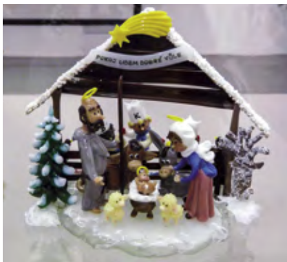
Zimní pátky v Železném Brodě

A lot of chateaux and castles are open on weekends during the winter season. The Dětenice Chateau holds jousting tournaments and unusual candle-lit tours on Saturdays. Similarly, the Staré Hradý Castle and Chateau is opened on weekends and offers programmes for both children and adults. Sychrov Chateau is also open all year round. Extraordinary tours that are often associated with cultural programmes are held in Kost Castle , Hrubý Rohozec Chateau and Valdštejn Castle at Christmas. Upon previous arrangements, the Valečov castle ruins can be accessed. Bozkovské dolomitové jeskyně (dolomite caves) are actually more pleasant in winter than in summer.