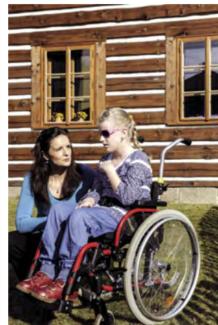
Kamenářský dům, Turnov

Bližší informace o turistické nabídce (hrady, zámky, muzea atd.) a službách (ubytovací a stravovací zařízení) pro osoby se sníženou pohyblivostí najdete na www.cesky-raj.info (Český ráj bez bariér). Dále zde najdete podrobný popis 20 doporučených výletů a tipy na třídní pobyty v Českém ráji. Věříme, že si z naší nabídky vyberete a strávíte v Českém ráji příjemné chvíle plné zážitků.