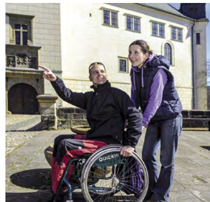
Zámek Hrubý Rohozec