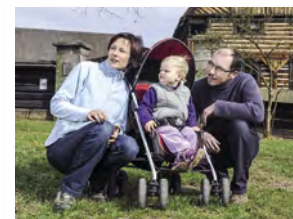
Dlaskův statek, Dolánky u Turnova