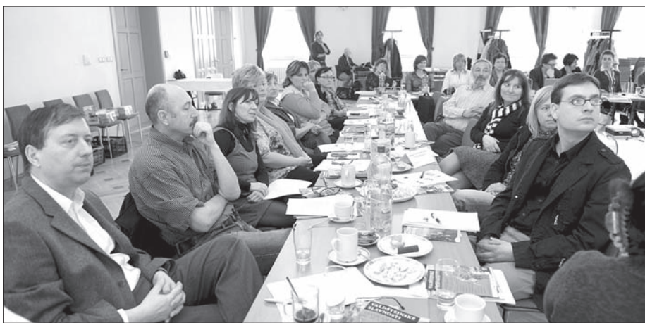
Ilustrační snímek z lomnického setkání.

Infocentrum Mladá Boleslav, které poskytuje své služby obyvatelům i návštěvníkům města, je od čtvrtka 24. března nově otevřeno v podloubí staré radnice na Staroměstském náměstí čp. 69. Infocentrum se přestěhovalo z důvodu rekonstrukce stávajících nevyhovujících prostor. Otevírací doba v nových prostorách zůstává stejná, tedy pondělí až pátek od 8.00 do 17.00 a v sobotu od 9.00 do 12.00 hodin. Telefonní spojení 326 322 173 prozatím ještě není v provozu, ale zájemci mohou volat na telefonní číslo 326 109 402.