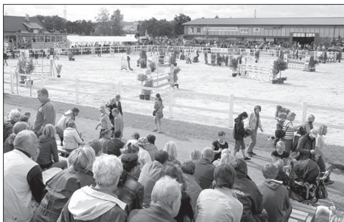
Vyhlášené kolbiště farmy Ptýrov.