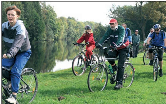
Ilustrační foto z minulých cyklojízdy.