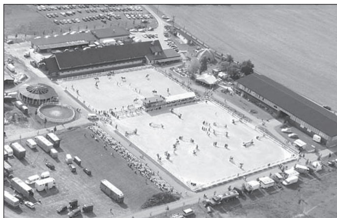
Farma Ptýrov z nadhledu.

Více o farmě Ptýrov najdete na www.farmaptýrov.cz .